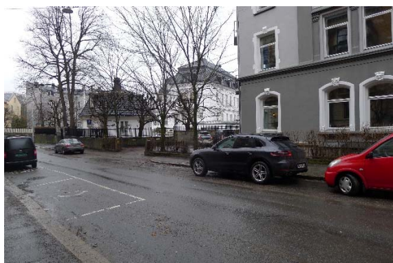
Meltzers gt. 4 fra krysset ved Oscars gt.

Som tidligere annonsert, har vi fått tilgang til et nytt møtelokale i Meltzers gt. 4. Dit kommer man til fots på 8-10 minutter ved å følge Oscars gt. til den krysser Meltzers gt. ved Chiles ambassade. Ta til venstre ned mot Incognito gt. På høyre side av gaten når man er vendt mot Slottsparken, er det til høyre, like før krysset en innkjørsel og parkering. Det er første dør i bygget til høyre for parkeringen. I bildet nedenunder, er døren like bak den hvite varebilen.