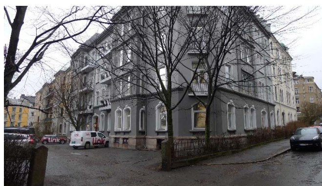
Innkjørselen fra Meltzers gt. – Inngang bak den hvite bilen